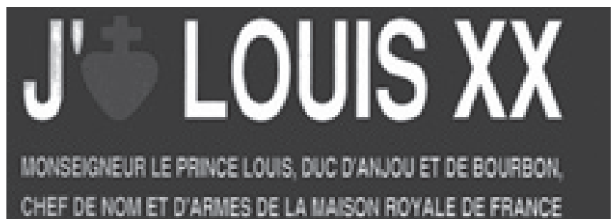
Royalistische Utopie. Propaganda für einen aussichtslosen Prätendenten

Angesichts der Ereignisse in den vergangenen Monaten hat sich mancher dieses Buches erinnert, sogar die FAZ wies darauf hin und die lange vergriffene deutsche Ausgabe liegt mittlerweile wieder vor (Tübingen: Hohenrain 2005, 272 S., kt, 17,80€). Raspail selbst sah sich durch die Aufstände in den banlieues zu